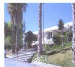
Escola Secundária Fernão Mendes Pinto Almada - Portugal