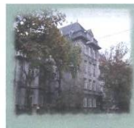
Szent István Közgazdasági Szakközépiskola, Budapeste - Hungria visita

PROJECTO COMENIUS COMENIUS PROJEKT "UM OLHAR SOBRE CULTURAS DE JOVENS NA EUROPA" „EINBLICK IN EUROPÄISCHE JUGENDKULTUREN“